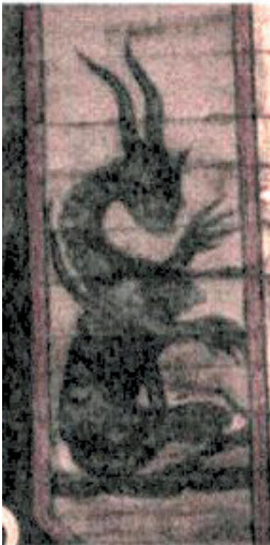
Lambris à MIRÉ